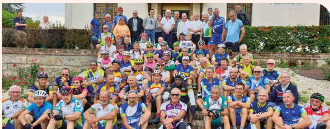
Départ de la randonnée du 25 septembre 2021 à Montlhéry

Retrouvez-nous en ligne sur latomatecontreladystonie.fr